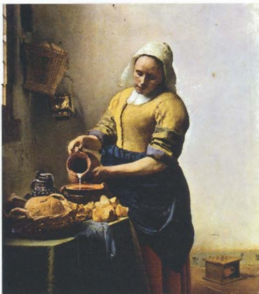
Jan Vermeer, 1658, Kökspigan, Rijksmuseum, Amsterdam.