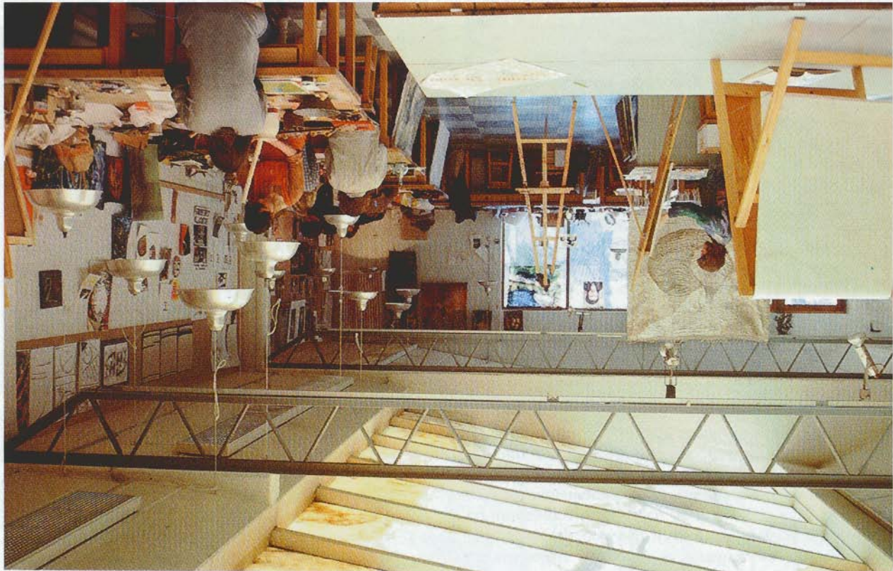
Gamla ateljen vid Estetiska linjen på Östra Grevies folkhögskola 1968-80.